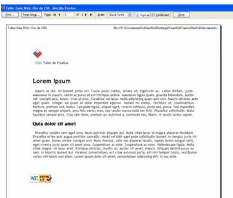
Figura 3. - Así se ve el contenido del sitio web cuando se aprecia en la visualización para impresión.

La intención de entregar estos archivos es que el usuario de la Guía pueda trabajar con ellos y hacerles las modificaciones que estime adecuadas, para ir aprendiendo sobre la marcha el efecto que consigue a través de los cambios que realice.