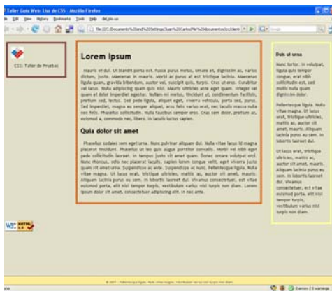
Figura 2. - Archivo que muestra el contenido del sitio tal como se ve a través de un browser: logotipo en una columna, más otras dos columnas de contenidos.